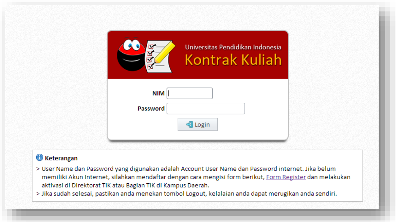
Gambar 2. Form Login

Untuk masuk ke sistem harus menggunakan username dan password yang digunakan untuk akses internet.