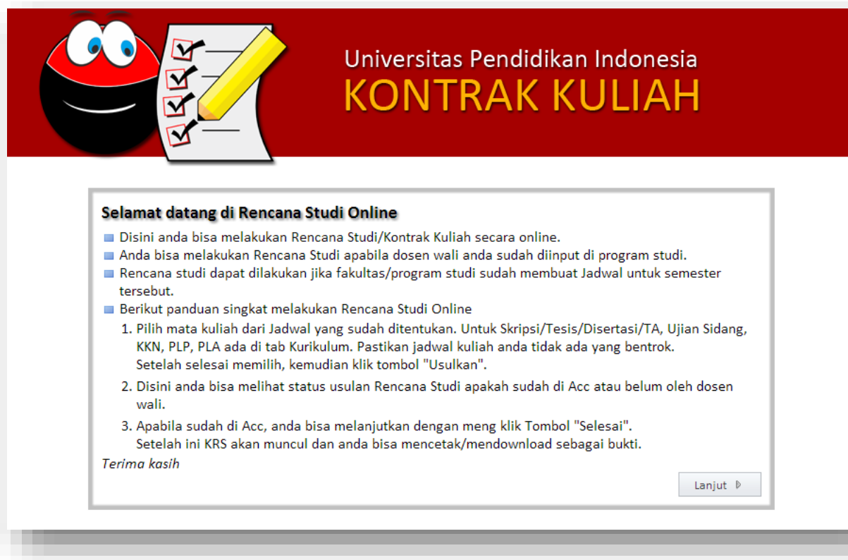
Gambar 1 Halaman Depan Sistem Kontrak Kuliah Online

Sistem kontrak kuliah ini bisa diakses menggunakan browser di alamat http://siak.upi.edu/kontrak . Sistem ini berbasis web sehingga bisa diakses dimanapun dan kapanpun selama komputer yang digunakan terkoneksi ke internet.